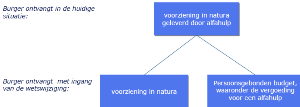
Figuur 1: Burgers die nu alfahulp ontvangen krijgen een brief met twee keuzemogelijkheden

Als de burger de voorziening zelf wil regelen, kan hij een persoonsgebonden budget – waaronder de vergoeding voor de alfahulp – aanvragen. De burger regelt dan zelf zijn voorziening. De burger ontvangt van de gemeente een bedrag waarmee de burger de voorziening zelf kan inkopen. Voor deze doelgroep verdient het de aanbeveling om een aanvraagformulier bij de informatiebrief te voegen, waarop de burger kan aangeven over welke vorm van hulp bij het huishouden hij/zij meer informatie wil en uiteindelijk een keuze schriftelijk vast te laten leggen 4 . Daarnaast is het verstandig om de mogelijkheid te bieden om extra informatie te verkrijgen via het Wmo-loket. In figuur 1 worden de keuzemogelijkheden voor de burger die momenteel de voorziening in natura via een alfahulp ontvangt schematisch weergegeven.